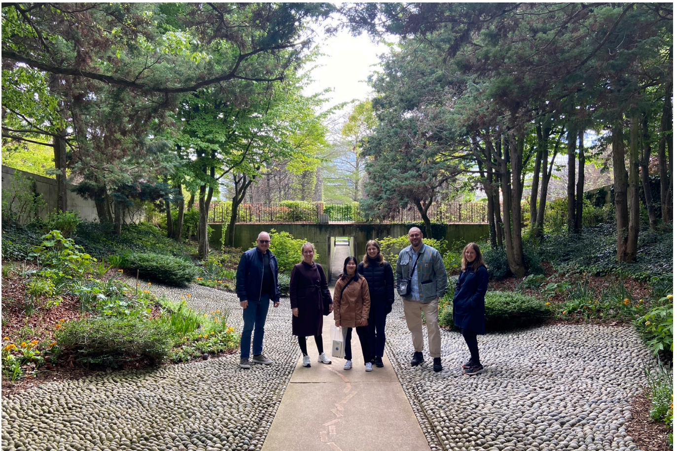
Tegnestuen på studietur i Paris - Citroën Parc - 2023

Opgaverne spænder vidt og indbefatter oftest en landskabelig og arkitektonisk tilgang, hvor kontekst og helhedsløsningen i de enkelte projekter styrker det samlede koncept. Vores registreringer har altid en synsvinkel på 'Stedets ånd/Genius Logi' , hvad der giver stedet en særlig værdi, og hvad der skal værnes om og løftes gennem løsning af opgaven.