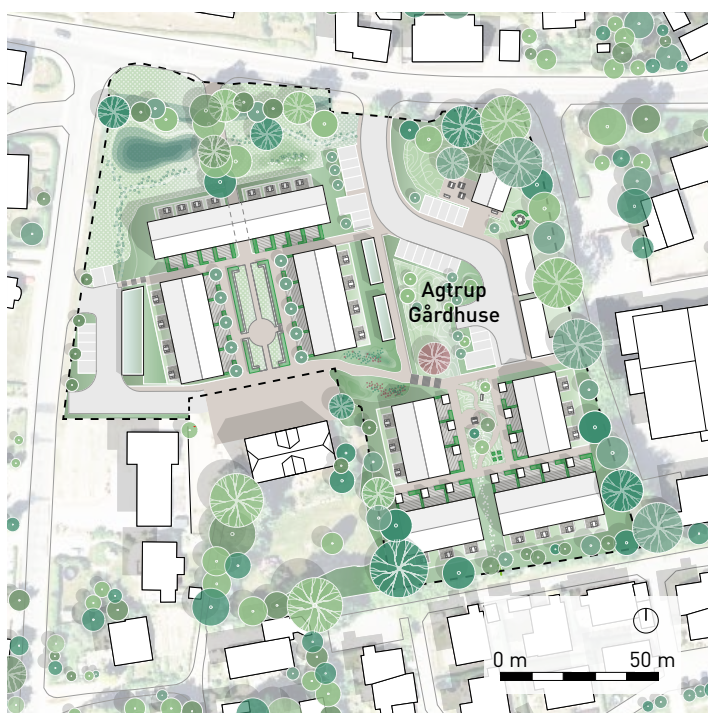
Seniorbofællesskabet Agtrup Gårdhuse, Kolding

Bregenov Architects har som hovedrådgiver på projektet været med helt fra start og foretaget de nødvendige forundersøgelser. Herefter har vi udformet en detaljeret bebyggelsesplan for området, som har dannet grundlag for en af Kolding Kommune udarbejdet lokalplan. Bregenov Architects har også formgivet samtlige bygninger og uderum i området.