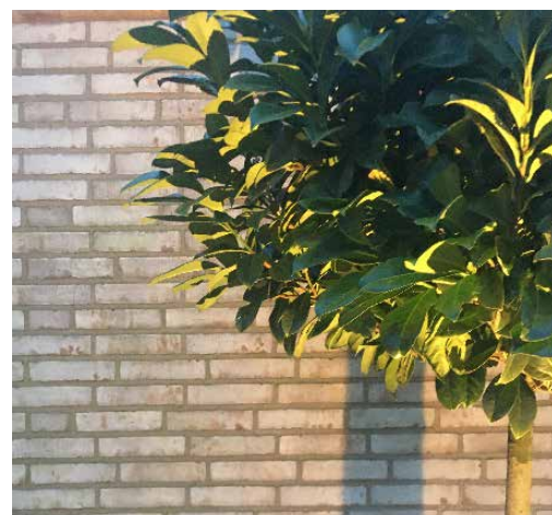
Udearealer til Villa Bregebo, Horsens

Vi inddrager specialister løbende, og har tæt sparring med botanikere, gartnere, landinspektører, vejingeniører mv., og gennem den tværfaglige tilgang opnår vi gode og robuste projekter.