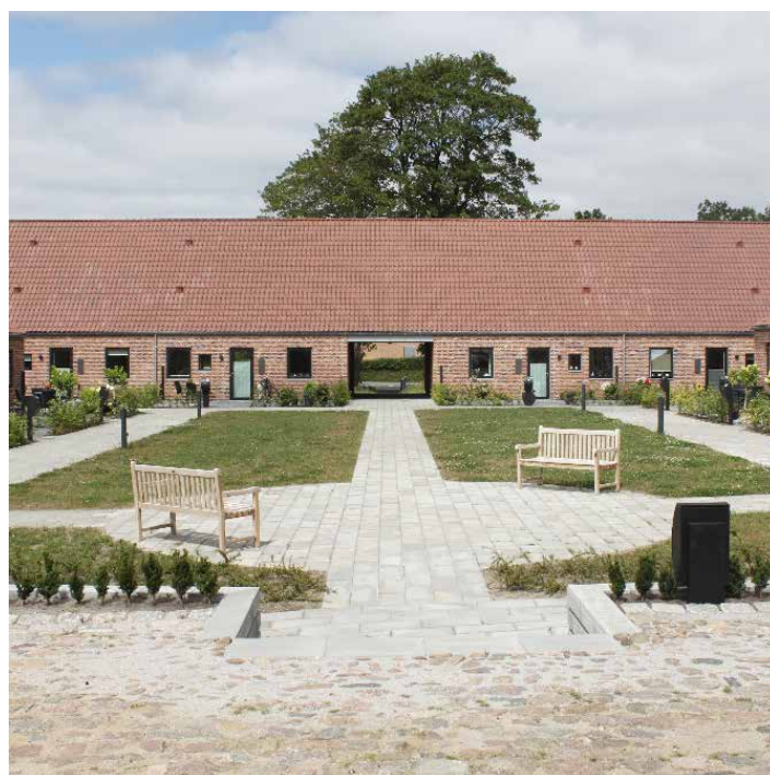
Seniorbofællesskabet Agtrup Gårdhuse, Kolding

De projekter, som vi er særligt stolte af at være en del af, er de projekter, som beriger folks liv. Projekter som understøtter fællesskaber, og som skaber fysiske rammer, der inviterer til at skabe relationer. Projekter som tør skille sig ud og være innovative, og projekter som udtrykker en holdning.